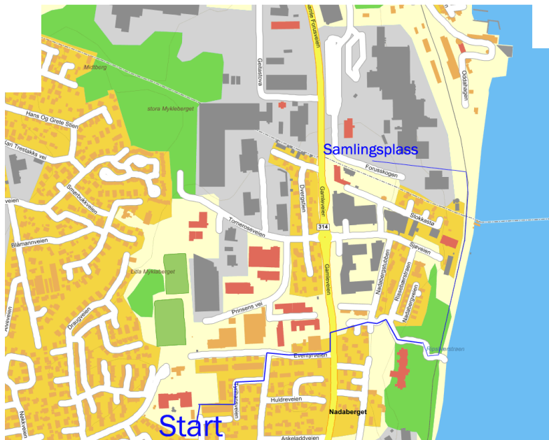
Fra samlingsplass til start.