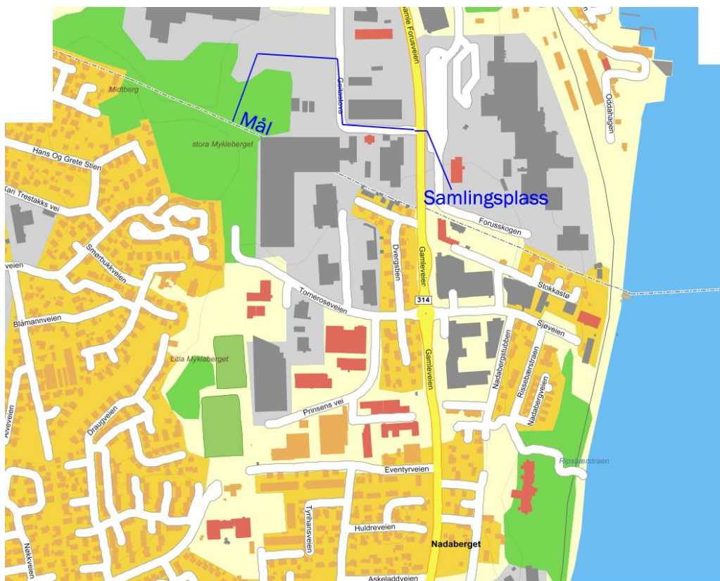
Veien fra mål til samlingsplass.

Etter målgang må man gå ca 400 m til samlingsplass der brikken skal registreres. Gamle Forusvei må krysses på vei til samlingsplass. Vær varsom og ta hensyn til biler. Det er ikke fotgjengerovergang på krysningsstedet!